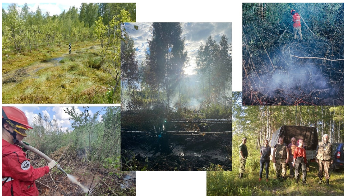
Фотоколлаж с выездов в июле 2022