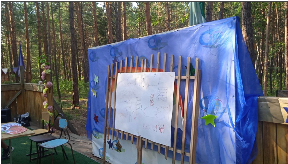
Интерактивный урок в детском лагере, Якутия.

Ежемесячно волонтеры за свой счет оплачивают услуги хостинга для бесперебойной работы сайта.