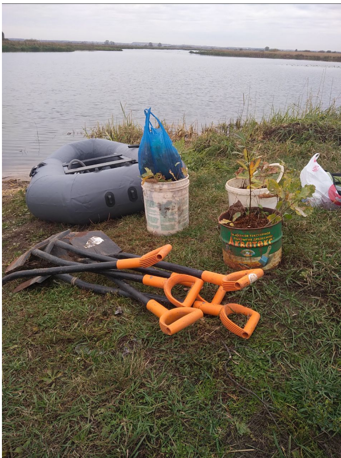
участие в лесопосадках